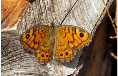
Landkärtchen Sommer und Winterform